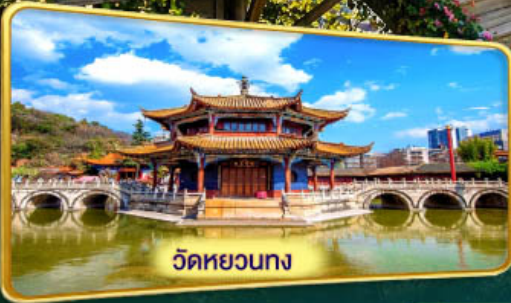
วัดหยวนกง