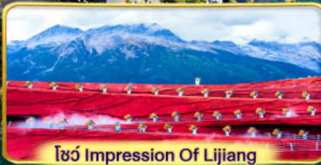
โชว์ Impression Of Lijiang