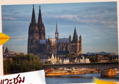
แควซม มหาวิหารโคโลญ