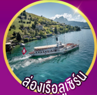
ล่องเรือลูซิิร์น