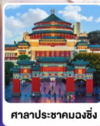
ศาลาประชาคมฉงชิ่ง