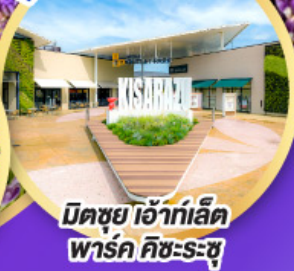
มิตซูเอะอิเกะ พาร์ค คิชะระชู