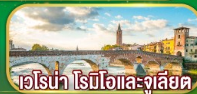
เวโรน่า โรมิโอและจูเลียต

เดินทาง 07-14 เม.ย. 69 / 02-09 พ.ค. 69 27 พ.ค. - 03 มิ.ย.69 / 17-24 มิ.ย.69 22-29 ก.ค. 69 / 11-18 ส.ค. 69 16-23 ก.ย. 69