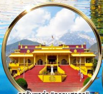
ดาริมซาล่า "ธรรมศาลา" ตำหนักองค์ดาไลลามะ