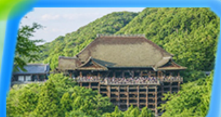
วัดน้ำใสคิโยมิสุเดระ