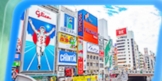
ชินไซบาชิ