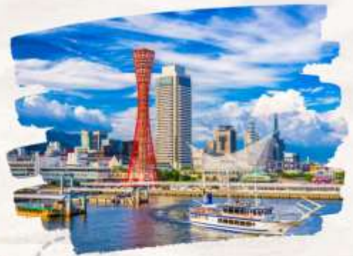
โทเบฮาร์เบอร์แลนด์

ทริปเที่ยวเที่ยวครบ ธรรมชาติ ศาลเจ้า ปราสาท และออนเซ็น