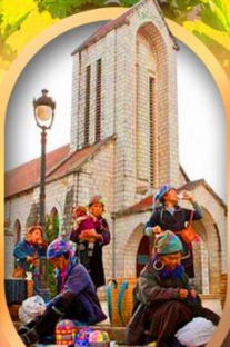
โบสถ์หินซาปา