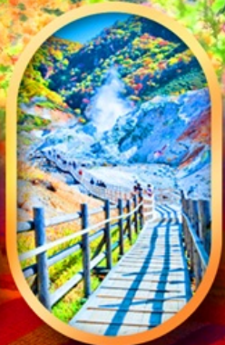
หุบเขานรกจิดอกุคาบิ