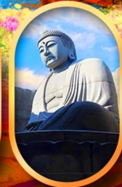
เบ็นเนาแห่งพระพุทธรเจ้า