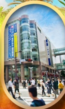
ช้อปปิ้งย่านกินจิน