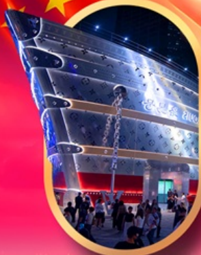
เรืออะหลุยส์