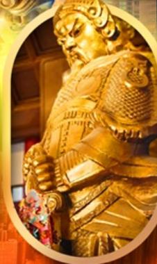
ทองพระวัดแซง

เที่ยว 2 ประเทศ 4 พอร์ วัดดัง ช้อปปิ้งจุใจ