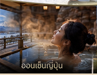
ออนเซ็นญี่ปุ่น