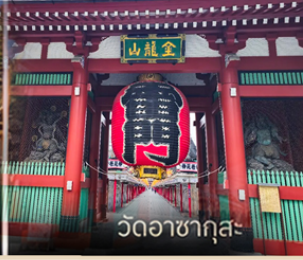
วัดอาสาซุกุสะ