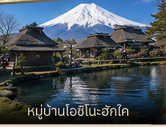
หมู่บ้านโอชิโนะอ๊กโค