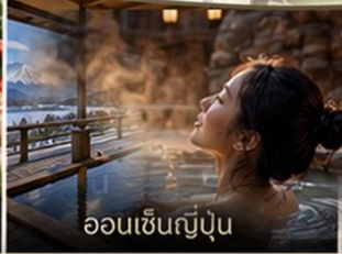
ออนเซ็นญี่ปุ่น