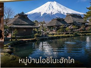
หมู่บ้านโอชิโนะอักษโค