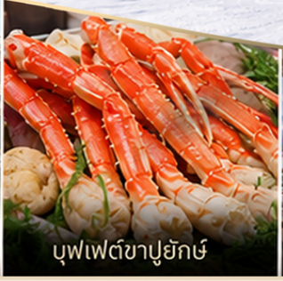
บุฟเฟ่ต์ซาปูยัคชิ