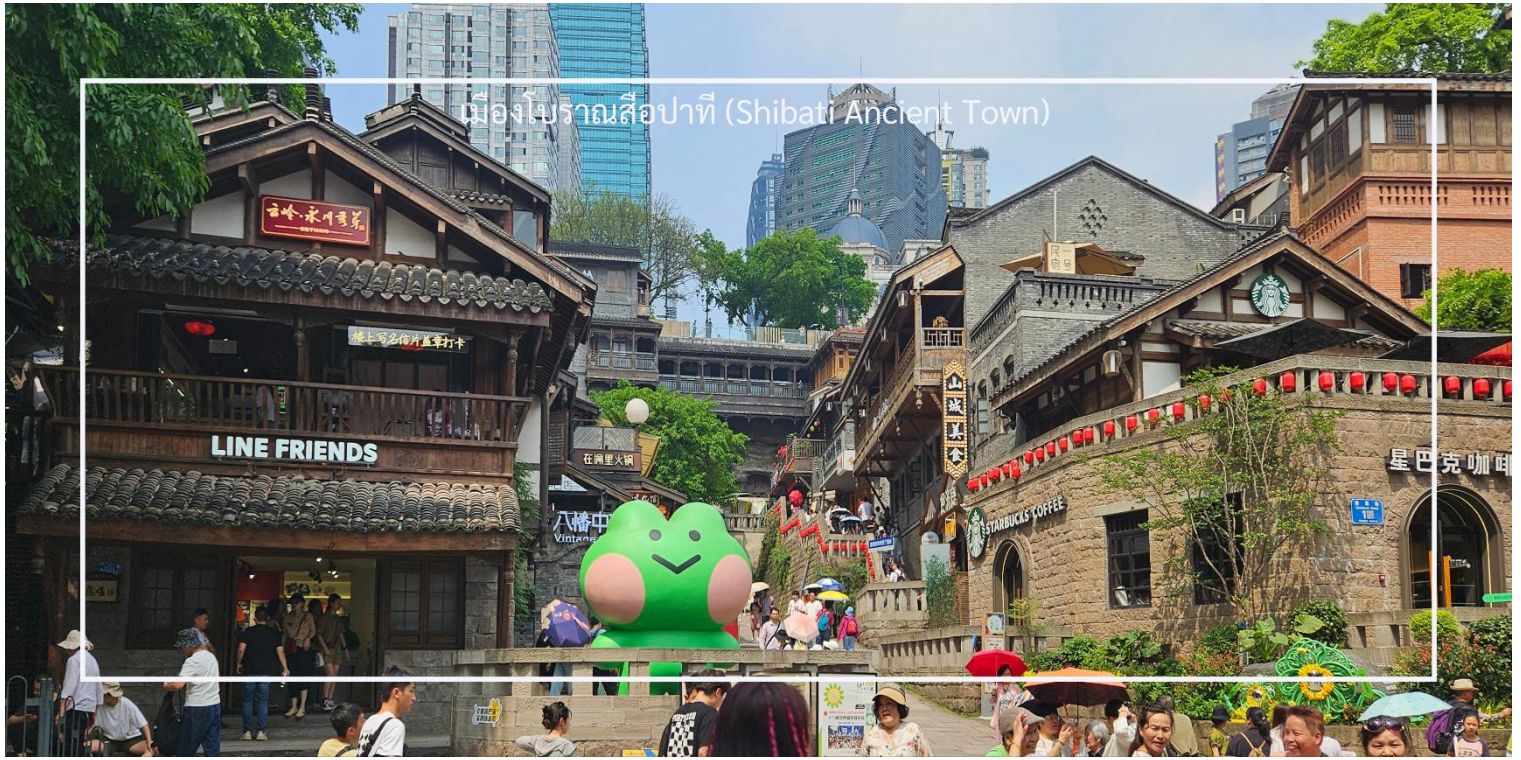
เมืองโบราณสี่ปาตี (Shibati Ancient Town)

ได้เวลาอันสมควร นำท่านเดินทางสู่สนามบินฉงชิ่ง เพื่อเดินทางกลับ