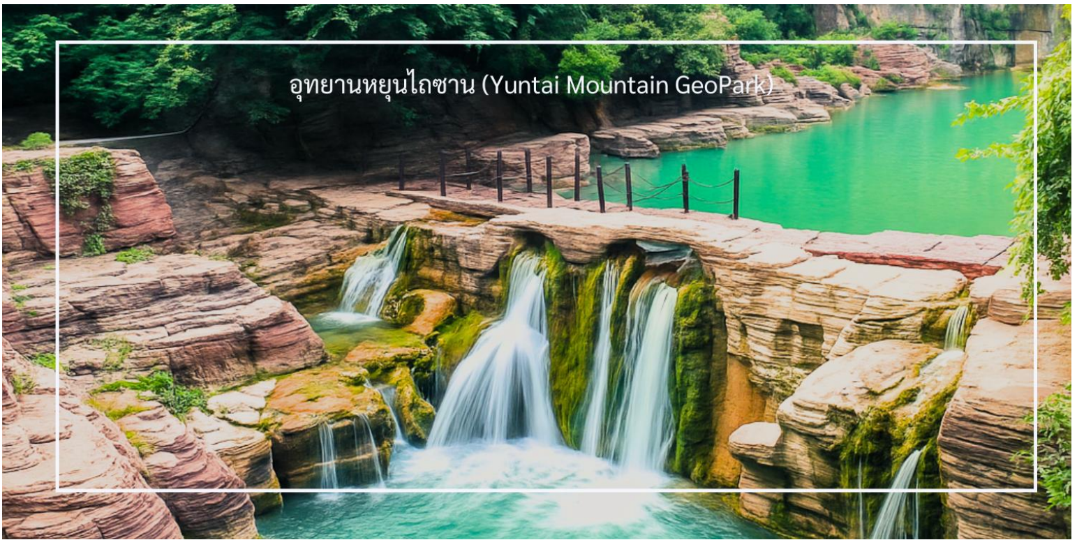
อุทยานหยุนไทซาน (Yuntai Mountain GeoPark)

เดินทางสู่ เมืองเต็งเฟิง ใช้เวลาเดินทางประมาณ 2 ชั่วโมง