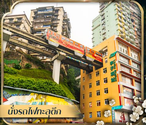
นั่งรถไฟทะลุติ๊ก

คอนเสิร์ตออกเดินทาง ตั้งแต่ 10 ท่าขึ้นไป