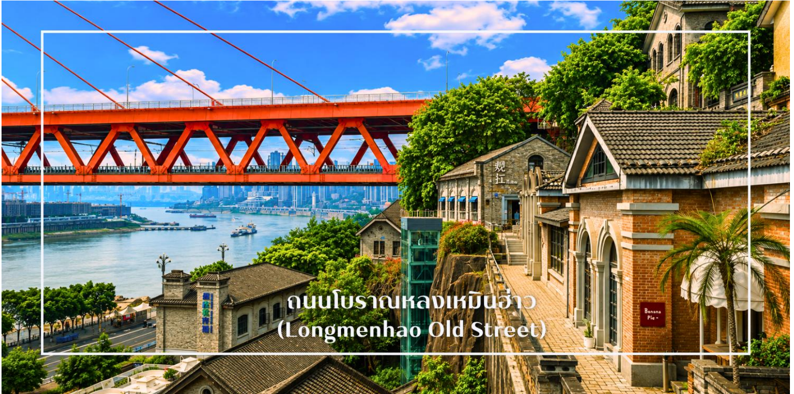
ถนนโบราณหลงเหมินฮ่าว (Longmenhao Old Street)

นำท่านสู่ ถนนโบราณหลงเหมินฮ่าว (Longmenhao Old Street) ถนนเก่าริมแม่น้ำอีกหนึ่งแลนด์มาร์กสำคัญของเมืองฉงชิ่ง ถนนสายนี้เคยเป็นย่านการค้าและศูนย์กลางเศรษฐกิจที่รุ่งเรืองในยุคราชวงศ์หมิงและชิง ปัจจุบันได้รับการอนุรักษ์ไว้เป็นอย่างดี เพื่อเป็นแหล่งเรียนรู้ทางประวัติศาสตร์ และแหล่งท่องเที่ยวเชิงวัฒนธรรมที่เต็มไปด้วยเสน่ห์ บรรยากาศของถนนยังคงอบอวลไปด้วยกลิ่นอายวันวาน อาคารบ้านเรือนแบบโบราณผสมผสานกับร้านค้า ร้านอาหาร และแกลเลอรีร่วมสมัยอย่างลงตัว อีกทั้งยังเป็นจุดชมวิวแม่น้ำที่โดดเด่น สามารถมองเห็นสะพานข้ามแม่น้ำแยงซีและทัศนียภาพของเมืองฉงชิ่งในมุมที่สวยงาม ท่านสามารถเดินชมถ่ายภาพหรือเช็คอินคาเฟ่ได้อย่างอิสระ