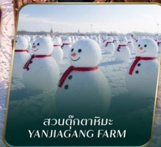
สวนตุ๊กตาหิมะ YANJIAGANG FARM