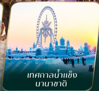
เทศกาลน้ำแข็ง นานาชาติ