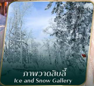
ภาพวาดสิบลี้ Ice and Snow Gallery

ตั๋วเครื่องบินออกเดินทาง ตั้งแต่ 15 วันขึ้นไป