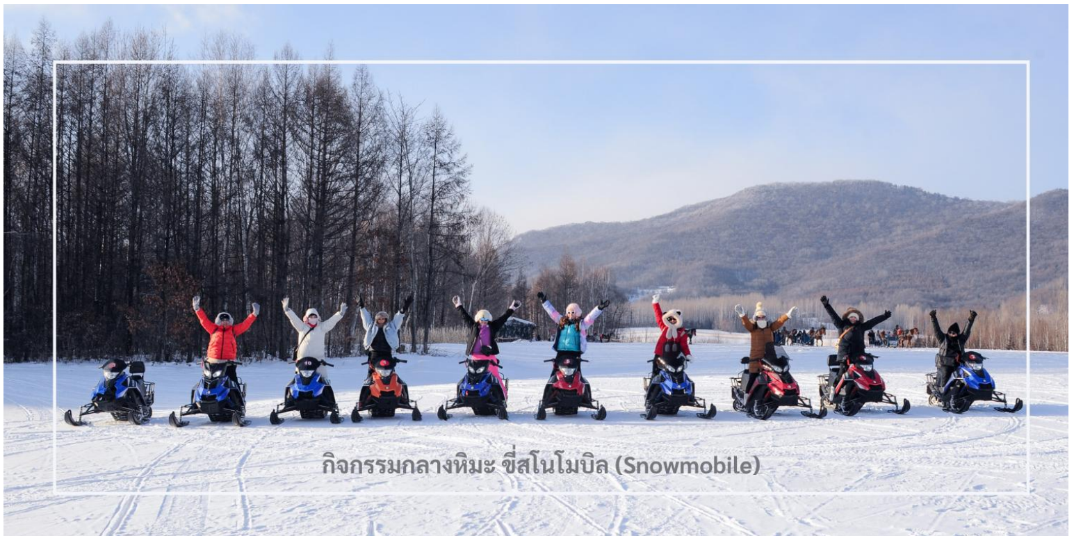
กิจกรรมกลางหิมะ ซีสนโมบิล (Snowmobile)

สมควรแก่เวลานำท่านเดินทางสู่เมือง มู่ตันเจียง (Mudanjiang) ใช้เวลาเดินทางประมาณ 2 ชั่วโมง มู่ตันเจียง เมืองสำคัญตั้งอยู่ใกล้พรมแดนรัสเซีย ห่างไปทางตะวันตกประมาณ 110 กิโลเมตร เมืองนี้มีเอกลักษณ์วัฒนธรรม และสถาปัตยกรรมที่ผสมผสานระหว่างรัสเซียและจีน โดยเฉพาะในฤดูหนาวเมืองจะถูกปกคลุมด้วยหิมะขาวโพลน