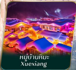
หมู่บ้านหิมะ Xuexiang