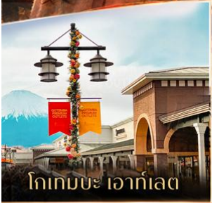
โทเทมปะ เอาร์ทเอด

✈ คอนเฟิร์มออกเดินทาง ตั้งแต่ 15 ท่าน ขึ้นไป