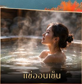
แช่ออนเซ็น