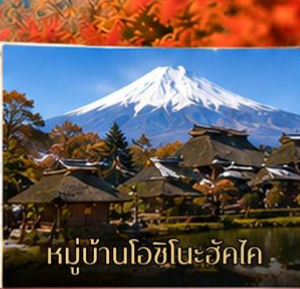
หมู่บ้านโอชิโนะอ็คโค