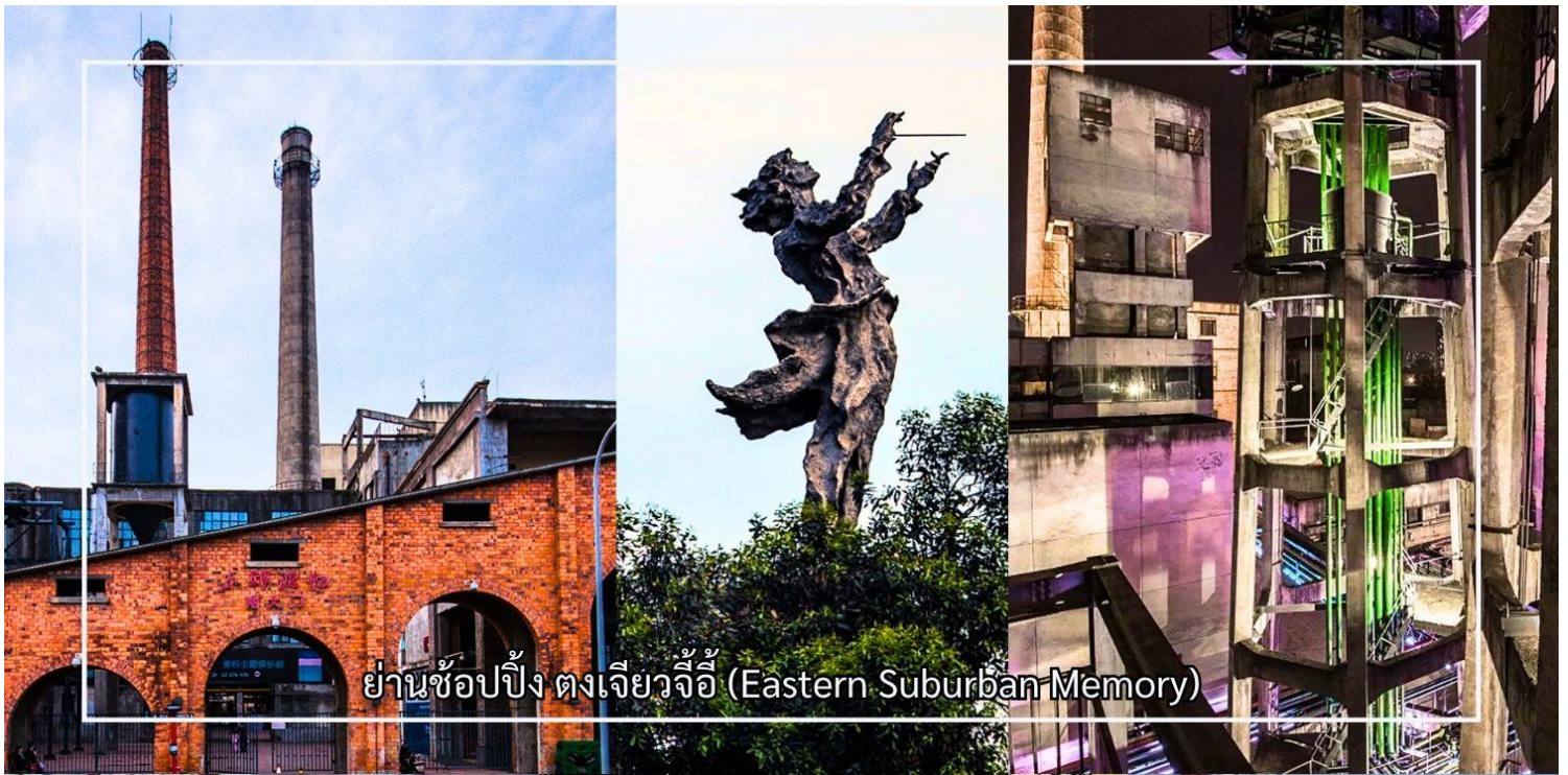
ย่านช้อปปิ้ง ตงเจียวจี้ (Eastern Suburban Memory)

นำท่านสู่ Eastern Suburb Memory ย่านท่องเที่ยวเชิงสร้างสรรค์ที่ถูกพัฒนาจากพื้นที่โรงงานอุตสาหกรรมเก่า ให้กลายเป็นแหล่งศิลปะและไลฟ์สไตล์ของเมืองเฉิงตู ภายในพื้นที่ที่ถูกออกแบบให้เป็นคอมมูนิตี้อาร์ตขนาดใหญ่ เต็มไปด้วยแกลเลอรีงานศิลปะ โรงภาพยนตร์ ร้านอาหาร คาเฟ่ ร้านเสื้อผ้า และพื้นที่นั่งพักผ่อน เหมาะสำหรับการเดินเล่น ชมงานศิลป์ และถ่ายภาพในมุมที่มีเอกลักษณ์เฉพาะตัว ถือเป็นศูนย์รวมของวัฒนธรรมร่วมสมัยและความคิดสร้างสรรค์ เหมาะสำหรับผู้ที่ชื่นชอบงานศิลปะและบรรยากาศแนวอาร์ต