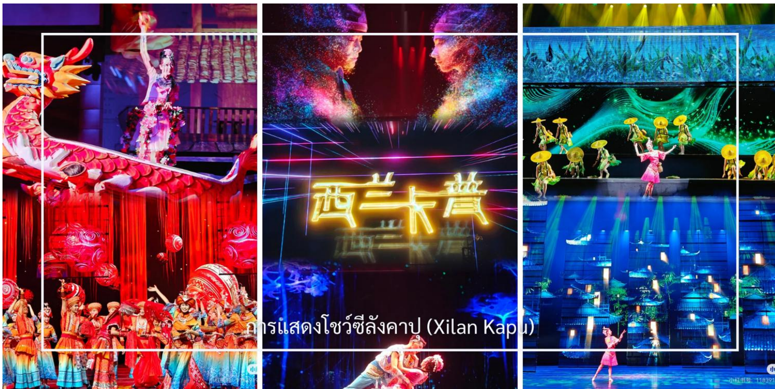
การแสดงโชว์ซีลิ่งคาปู (Xilan Kapu)

จากนั้นนำท่านรับชมการแสดงวัฒนธรรมพื้นบ้าน “ซีลิ่งคาปู” อันเป็นศิลปะการแสดงที่สะท้อนอัตลักษณ์และภูมิปัญญาท้องถิ่นได้อย่างลึกซึ้ง การแสดงถ่ายทอดเรื่องราวของวิถีชีวิต ความเชื่อ และขนบธรรมเนียมประเพณีของชุมชน ผ่านท่วงท่าการรำร่าที่อ่อนช้อย ผสานกับเสียงดนตรีพื้นเมืองที่มีเอกลักษณ์เฉพาะตัว พร้อมเครื่องแต่งกายสีสันงดงามที่บ่งบอกถึงรากเหง้าทางวัฒนธรรม