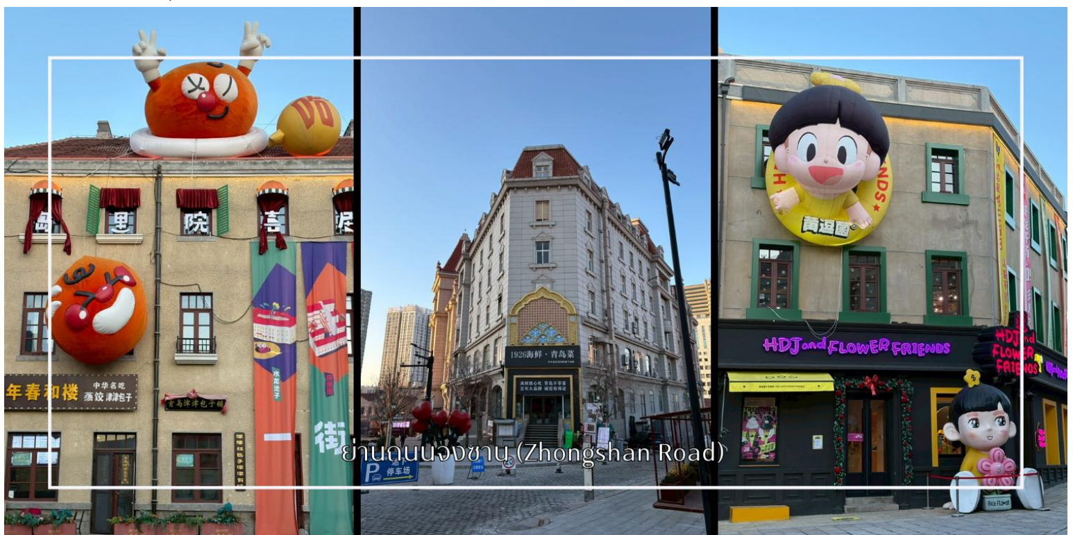
ย่านถนนจงซาน (Zhongshan Road)

นำท่านเดินชมบรรยากาศบน ถนนจงซาน (Zhongshan Road) ถนนสายเก่าแก่ใจกลางเมืองชิงเต่า ที่ได้มไปด้วยเสน่ห์ของอาคารสไตล์ยุโรปยุคอาณานิคมและกลิ่นอายเมืองท่าริมทะเลอันคึกคัก ถนนสายนี้ถือเป็นย่านการค้าสำคัญในอดีต ปัจจุบันเต็มไปด้วยร้านค้า ร้านอาหาร คาเฟ่ และร้านของฝากท้องถิ่นให้เลือกซื้ออย่างเพลิดเพลิน