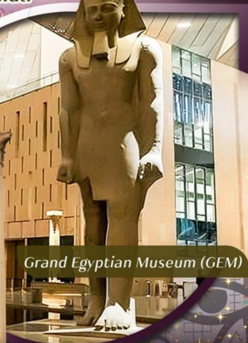
Grand Egyptian Museum (GEM)

คอนเฟิร์มออกเดินทาง ตั้งแต่ 15 ท่าน ขึ้นไป