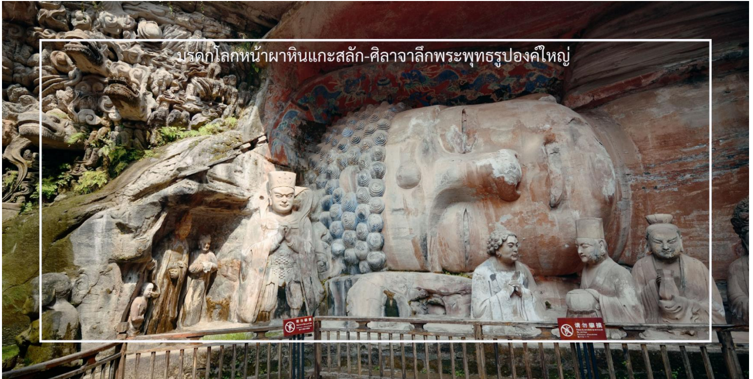
มรดกโลกหน้าผาหินแกะสลัก-ศิลาจากลี้พระพุทธรูปองค์ใหญ่

สถานที่สำคัญทางประวัติศาสตร์และศิลปกรรมอันล้ำค่า ตั้งอยู่ที่เขาเป่าตังซาน เมืองต้าจู๋ มณฑลเสฉวน ประเทศจีน ได้รับการขึ้นทะเบียนเป็นมรดกโลกโดยองค์การยูเนสโก ผลงานแกะสลักบนหน้าผาหินเหล่านี้มีอายุย้อนไปกว่า 1,200 ปี เป็นศิลาจากลี้พระพุทธรูปขนาดใหญ่ รวมถึงภาพจำหลักอันวิจิตรสะท้อนถึงแนวคิดพุทธศาสนา เต๋า และขงจื้อ ที่ผสมผสานอยู่ในงานศิลป์เดียวกัน ซึ่งภายในจะมีจุดเด่นที่สำคัญอันได้แก่