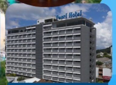
โรงแรมเพิร์ล