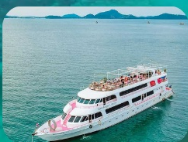
เกาะพีพีทัวร์