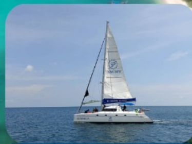
ล่องเรือยอร์ชชานเซ็ก