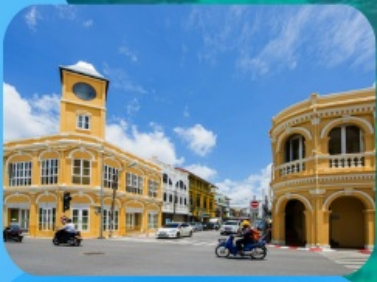
ภูเก็ตเมืองเก่า