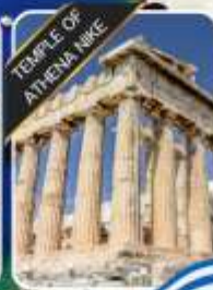
TEMPLE OF ATHENA NIKE