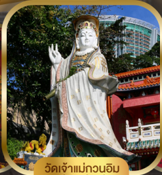
วัดเจ้าแม่กวนอิม ริฟาสึเบย์