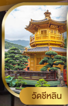
วัดซีหลิน