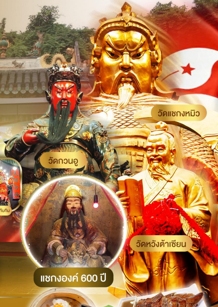
วัดเซกหมิว