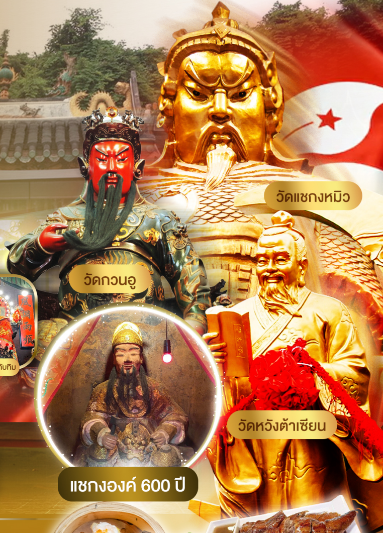
วัดเซกงหมิว