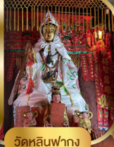
วัดหลินฟาง