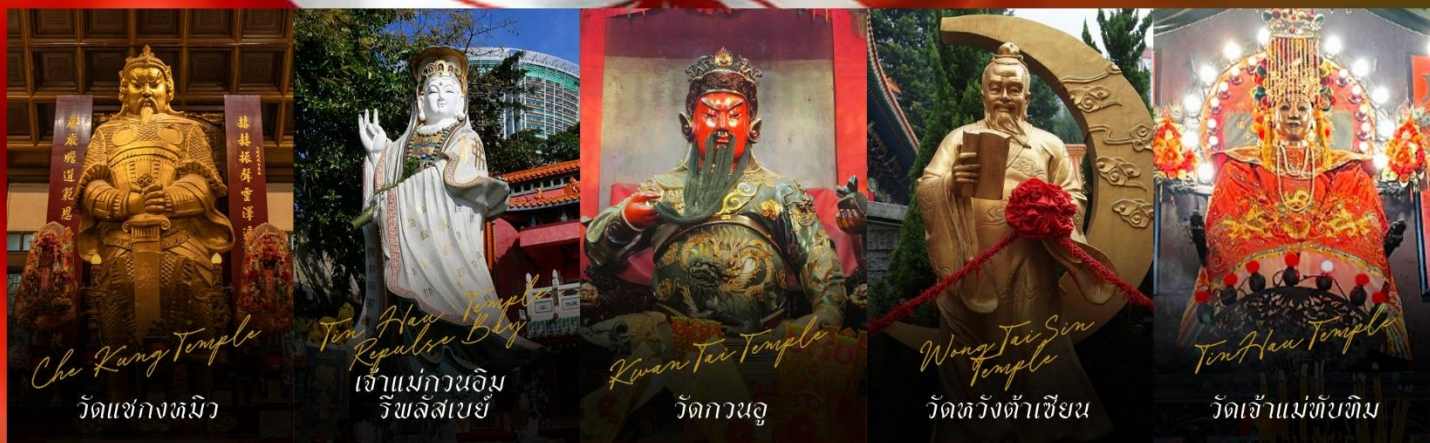
Che Kung Temple วัดแซกงหมิว

รายการทัวร์ข้างต้นอาจมีการปรับเปลี่ยนเพื่อความเหมาะสม