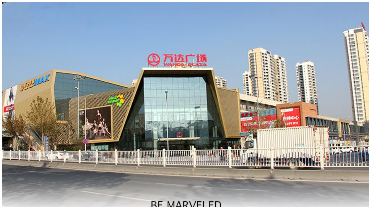
BE MARVELED ช้อปปังศูนย์การค้า (Qingdao Wanda Plaza)

ที่พัก HOLIDAY INN EXPRESS QINDAO หรือเทียบเท่าระดับ 4 ดาว