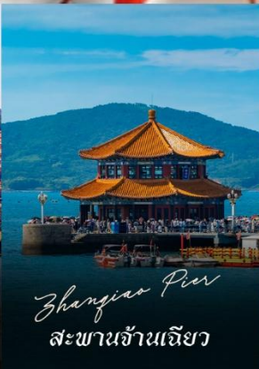
Zhangjiao Pier สะพานจ้านเจียว