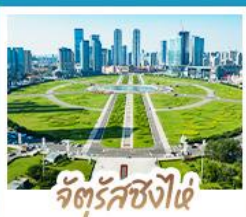
จัตุรัสชิงไฉ่