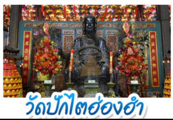
วัดปักไต้ฮ่องกง