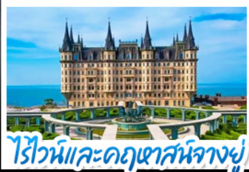
ไรไวน์และคฤหาสน์นางอยู่