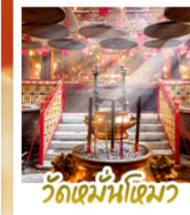
วัดหมื่นโหมว