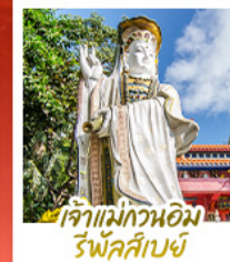
เจ้าแม่กวนอิม รัฟัสส์เบย์