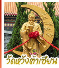
วัดเว้งต้าเซียน