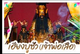
เซียงบูชิว (เจ้าพ่อเสือ)