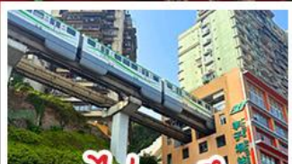
รถไฟทะลุคัง