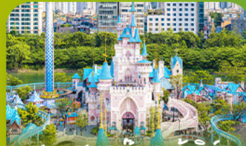
สวนสแกนดิเนเวีย Lotte 'adventure world