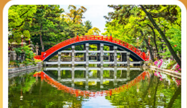
ศาลเจ้าสุมิโยชิ โกเบ