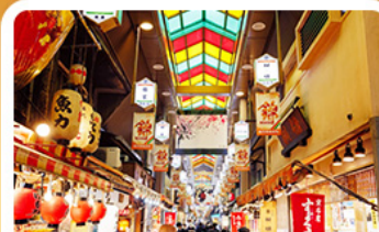
ตลาดปลาชิคิ