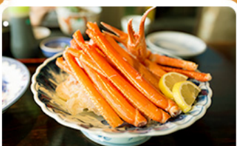
พิเศษ! ซาปู