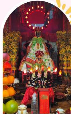
วัดเจ้าแม่กวนอิมฮ่องฮำ ขอพรเรื่องเงิน ทรัพย์สิน และความมั่งคั่ง