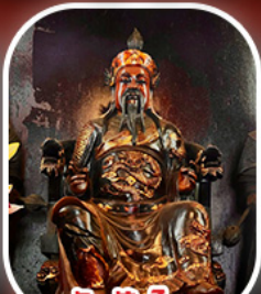
วัดปิกโก