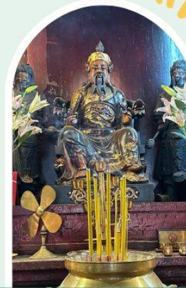
วัดปุกโตฮองฮำ