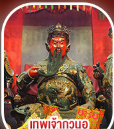
เทพเจ้ากวนอู วัดกวนโก