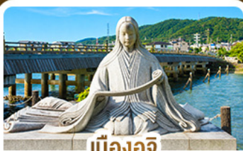
เมืองอูจิ สวรรค์คนรักชาเขียว

คามิโคจิ สวรรค์บนดินแห่งเทือกเขาแอลป์ ชมสะพานคิปปาบาชิ ชมวัดเนียวโดอิน • เมืองทาดายาม่า • ตลาดปลานิชิกิ • ช้อปปิ้งชินโซบาชิ • อีออนมอลล์