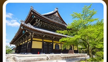
วัดนันเซ็นจิ