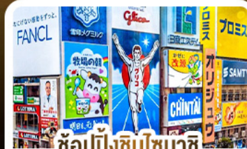
ช้อปปิ้งชินโซบาชิ และโดตงโมริ