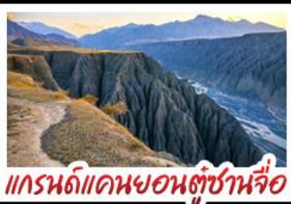
แกรนด์แคนยอนตุ่ซ่านจื่อ

ทะเลสาบไซหลู่มี - คานาสือ แกรนด์แคนยอนตุ่ซ่านจื่อ ตลาดแกรนด์บาชาร์ - หมู่บ้านหอมู่