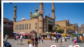
ตลาดแกรนด์บาชาร์