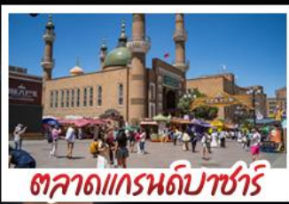
ตลาดแกรนด์บาชาร์