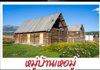
หมู่บ้านหอมู่