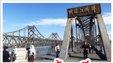
ตามองต้นเดียว