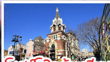
โบสถ์โกธิคต้าเหลียน