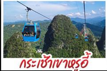
กระเช้าเขาหลูอี้