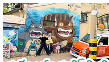
สตรีทอาร์ต สตุตโตโอจิบลิ