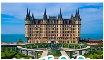
คฤหาสน์หวนเจิง