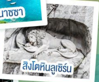
สิงโตหินลูเซิร์น