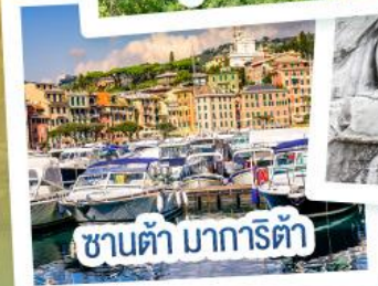
ซานต้า มารีตา