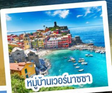
หมู่บ้านเวอร์นาซซา