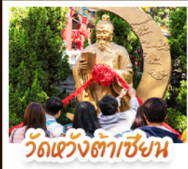
วัดเซ็งต้าเซียง