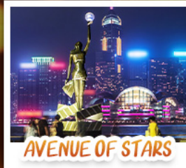
AVENUE OF STARS