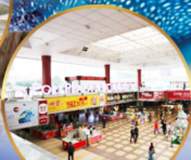
ตลาดกึ่งเปย์