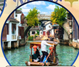
เมืองโบราณจูเจียเจีย