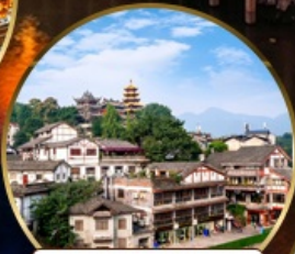
เมืองโบราณฉือจี้ไป๋