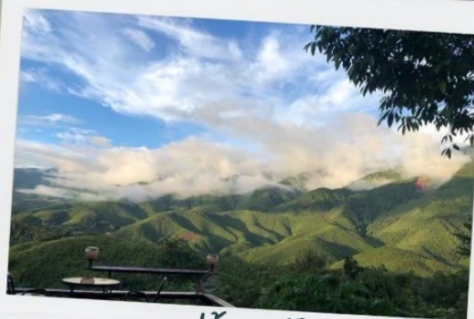
แม่บ้านสะบัน