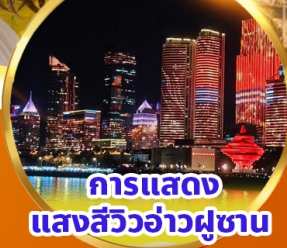
การแสดงแสงสีว้าวุ่น